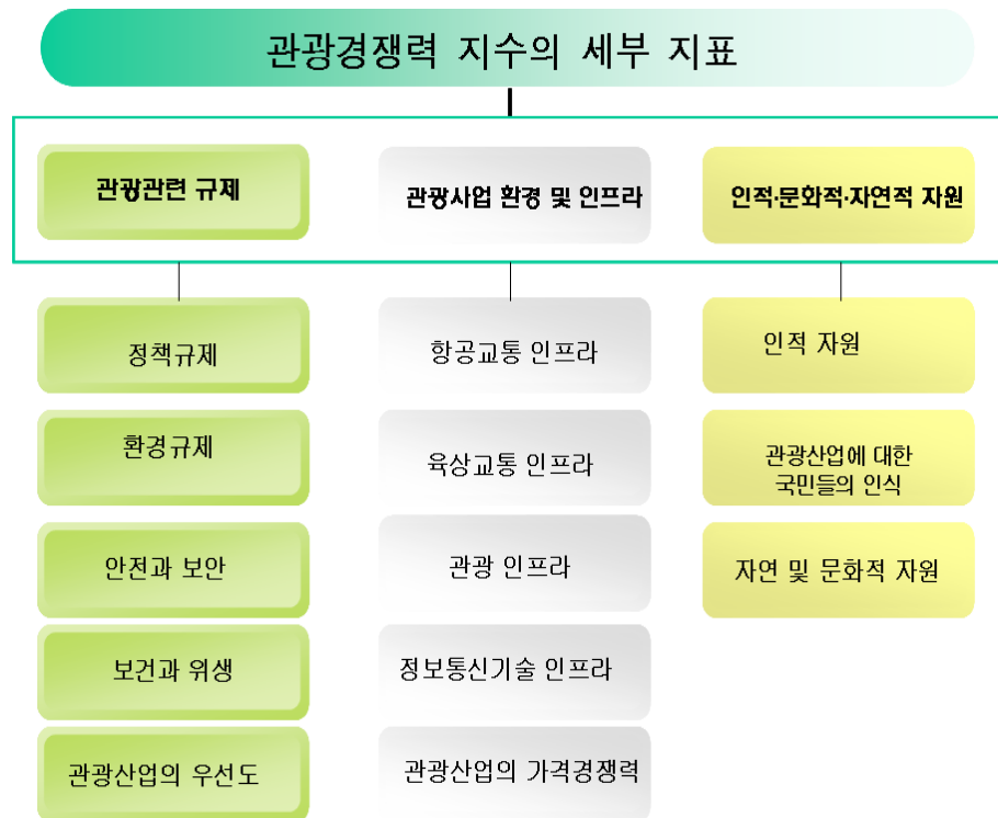
[그림 1] 관광경쟁력지수의 세부 평가항목