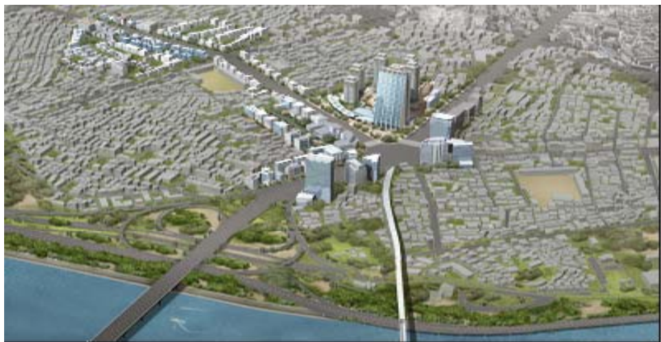
〈그림 3〉 합정균형발전촉진지구 조감도