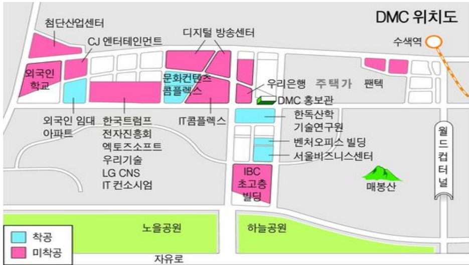
〈그림 1〉 상암 DMC 위치도