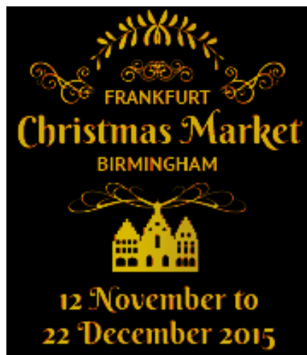
버밍엄 ‘프랑크푸르트 크리스마스 마켓’ 로고