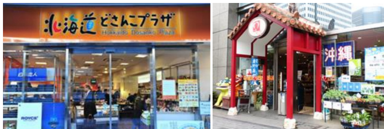
도쿄도 내에 위치한 북해도와 오키나와의 안테나숍