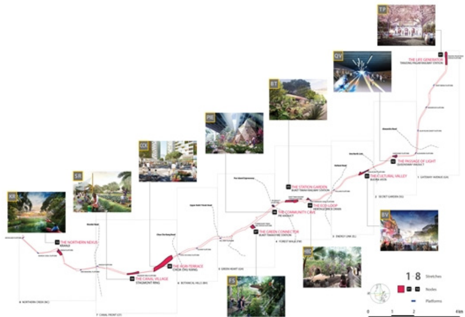
기본계획의 최종 당선안

http://www.ura.gov.sg/MS/railcorridor.aspx