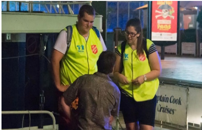
‘안전대사’의 활동 모습