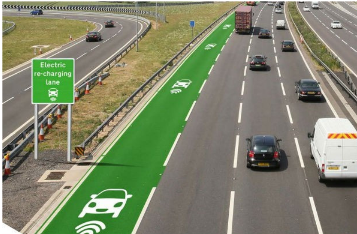
영국 고속도로의 전기차 충전 도로 설치 모습

http://www.citylab.com/tech/2015/11/netherlands-dutch-solar-powered-bike-lane-cycling-solaroad/416601/