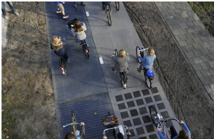
네덜란드의 태양광패널 도로 이용 모습