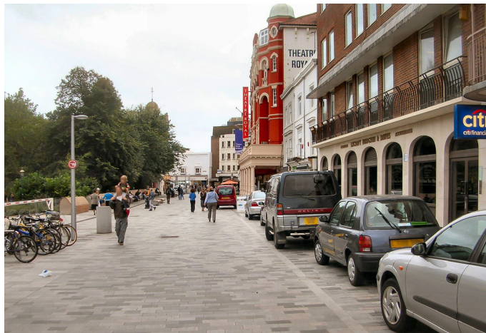
[그림 2] 영국 브라이턴(Brighton)시의 공유도로

http://www.chicagotribune.com/news/local/breaking/ct-chicago-shared-street-uptown-met-20160912-story.html