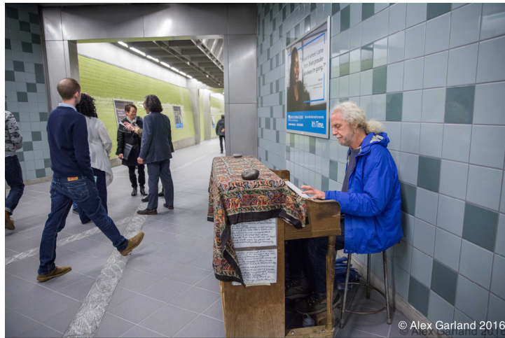
[그림 2] 경전철역 내 거리공연 모습