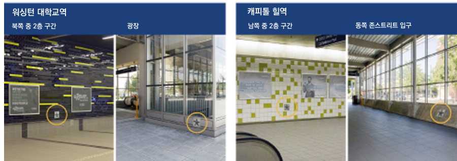
[그림 1] 경전철역 내 거리공연 허용장소 표시