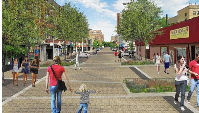
[그림 1] 시카고시 공유도로 개념도