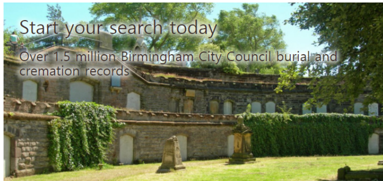
[그림 1] 버밍엄 뿌리찾기 홈페이지 메인 이미지

https://www.birmingham.gov.uk/news/article/190/new_database_to_help_brummies_discover_their_roots?utm_content=&utm_medium=email&utm_name=&utm_source=govdelivery&utm_term=