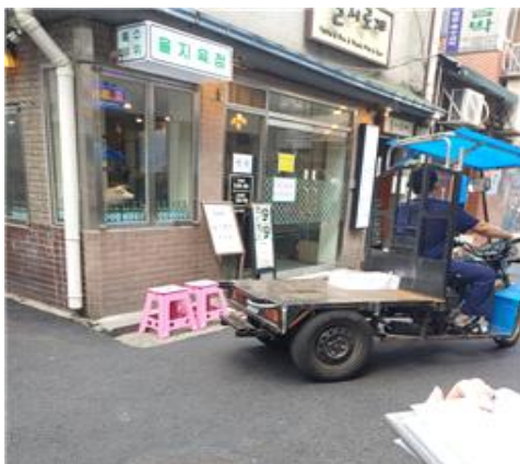
〈소로와 연결된 생활도로, 삼륜차〉