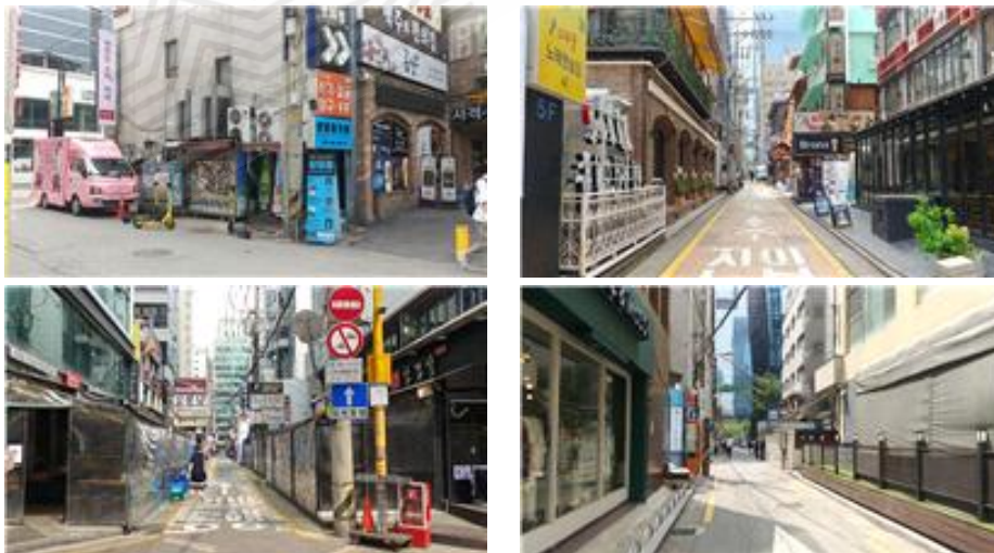
〈차량진입 어려운 지역 현장 확인〉