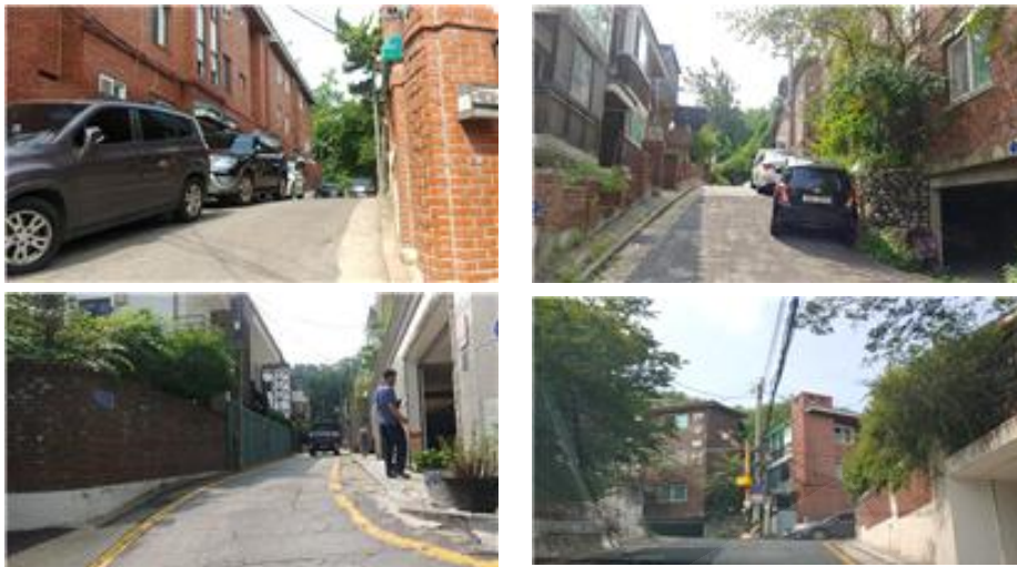
〈경사로, 차량진입 어려운 지역 현장 확인〉