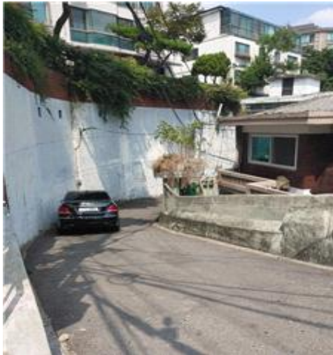
〈급경사 도로(주차시 차량 접근 불가)〉