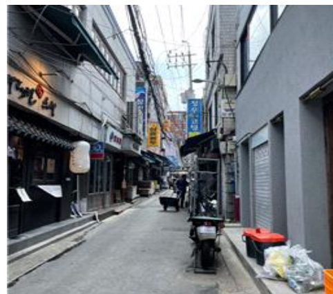
〈주간 쓰레기 배출 모습〉