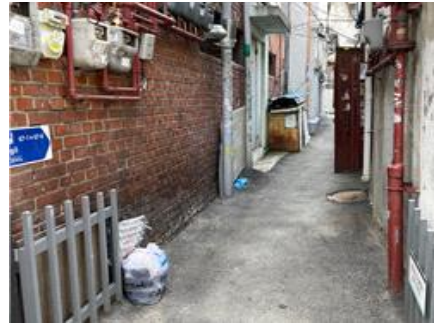
〈차량 진입이 어려운 소로(개미골목)〉