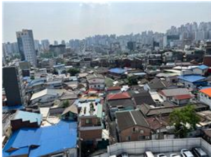
〈신당동 233 일대 주택가〉