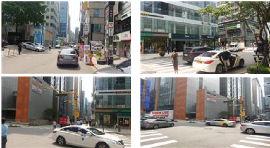
〈유동인구 및 차량 증가로 수거작업 불편 지역〉