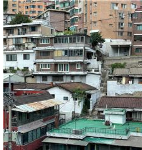
〈도보수거만 가능한 지역(계단, 경사 등)〉