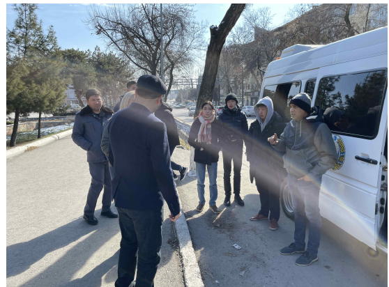
<그림 2> 타슈켄트시 현장조사