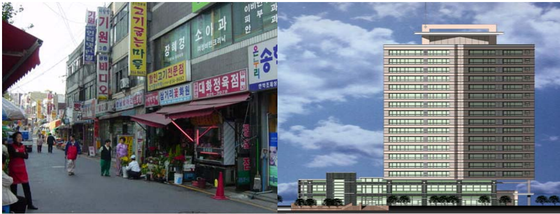
<그림 3> 신노량진시장 정비사업 전과 후