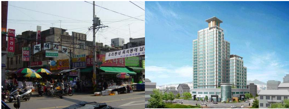
<그림 2> 흑석시장 정비사업 전과 후