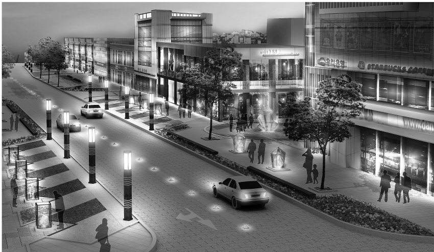
[그림 4] 특화거리 전경