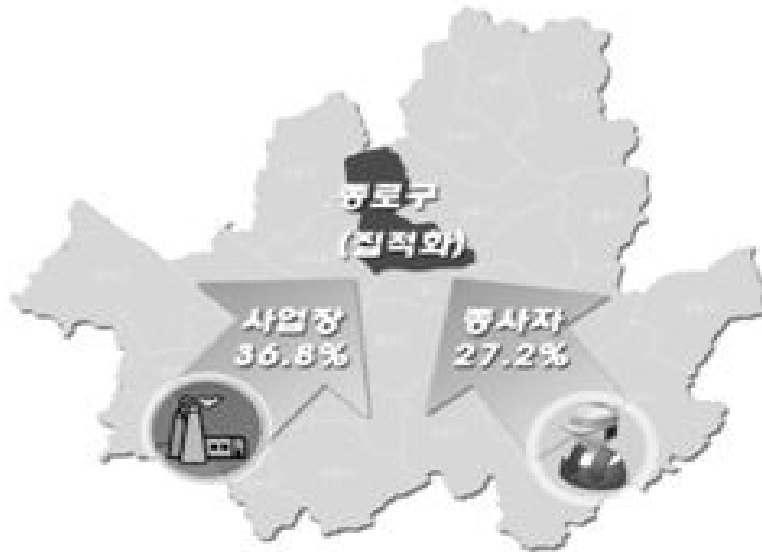
[그림 1] 종로 귀금속보석산업의 현황