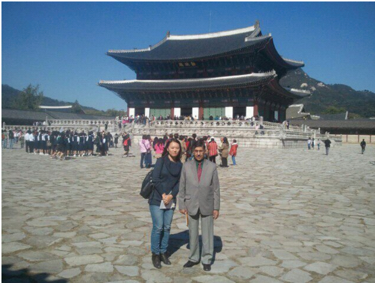
[그림] 외국인 교수님과 함께 경복궁 관광

않게 질적성장 또한 양적성장에 맞춰 동반성장 되어야만 꾸준한 산업발전을 기대할 수 있다. 따라서 앞으로 2천만 관광객 달성을 위해서는 좀 더 세심하고 다양한 관광프로그램이 필요할 것이다. 의료관광, 한류문화 등으로 한국을 찾는 관광객이 늘어나면서 많은 부분을 신 성장사업에 투자하고 있지만 관광자프로그램 개발에 있어 무엇보다 중요한 것은 가장 한국적이고 오랜 전통을 느낄 수 있는 그래서 오래도록 기억에 남을 수 있는 관광자프로그램 개발이 필요함을 느낄 수 있었다.